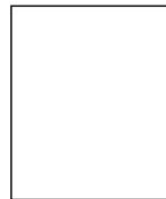
Huella Digital (índice derecho)

(*) Establece prohibiciones e incompatibilidades de funcionarios y servidores públicos, así como de las personas que presenten servicios bajo cualquier modalidad contractual.